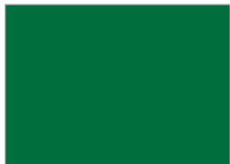
1. クロレラグリーン (dp12)