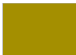
14. ストロングイエロー (dp8)