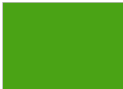
2. グリーンパイパー (V11)