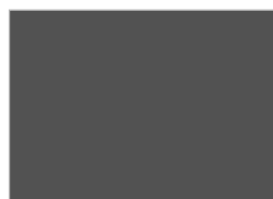
19. ミディアムグレー (Gy-3.5)