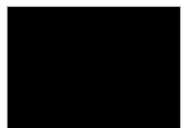
20. ブラック (BK)