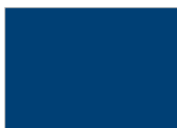
13. グレイッシュブルー (V20)