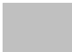
20. スペースシルバー (#C0C0C0)