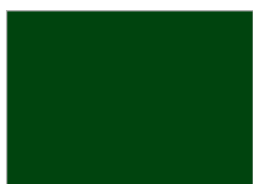
11. サイプレスグリーン (#00440E)