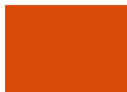
15. ハロウィン (#D84B06)