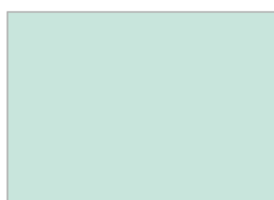
18. テムズリバー (#C8E5DC)