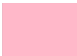
3. パウダーピンク (#FFB8C9)